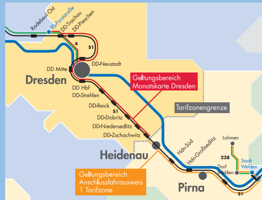
Karte Anschluss-ticket Tarifzone Pirna für Inhaber einer Monatskarte der Tarifzone Dresden