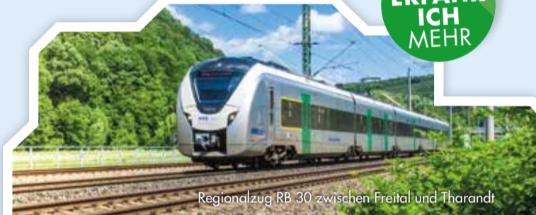
Regionalzug RB 30 zwischen Freital und Tharandt