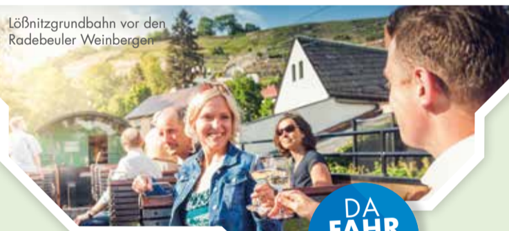
Löbnitzgrundbahn vor den Radebeuler Weinbergen