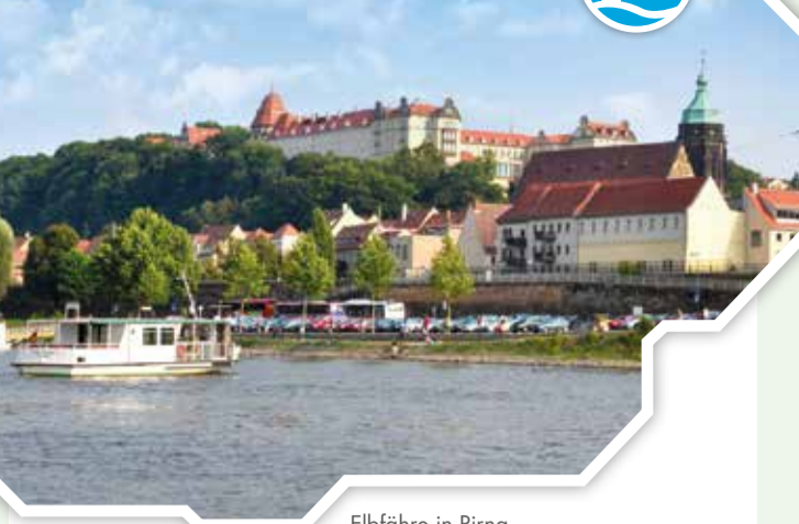
Elbfähre in Pirna

Im Verkehrsverbund Oberelbe gibt es derzeit 19 Fährstellen, davon allein 13 zwischen Dresden und Schöna. In der Sächsischen Schweiz verbindet die Fährten meist die idyllischen Ortszentren auf der rechten Elbseite mit den linkselblich gelegenen Bahnhöfen, etwa in Bad Schandau oder Wehlen – also eine Elbüberquerung mit Gleisanschluss.