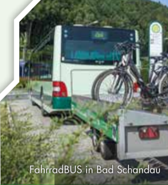
FahrradBUS in Bad Schandau

OVPS – Oberelbische Verkehrsgesellschaft Pirna-Sebnitz mbH Tel. 03501 / 79 21 60, www.ovps.de