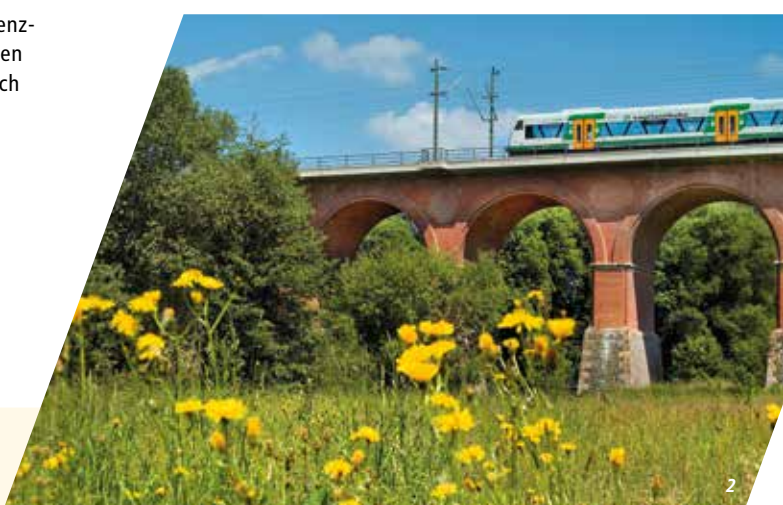
1 Familienausflug mit der vogtlandbahn 2 vogtlandbahn bei Steinpleis 3 Regiohuttle der vogtlandbahn