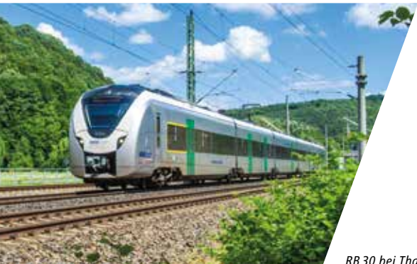
RB 30 bei Tharandt

Wir möchten Ihnen die Nutzung des öffentlichen Verkehrs so einfach wie möglich gestalten und verbessern die Anschlüsse zwischen Bus und Bahn, sorgen für ein einheitliches Tarifsystem, verständliche Informationen und kundenfreundlichen Service.