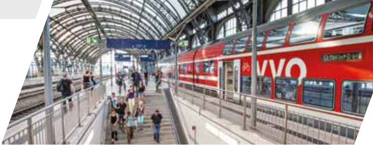
S-Bahn im Dresdner Hauptbahnhof

Weitere Informationen erhalten Sie bei den jeweiligen Bahngesellschaften sowie den InfoHotlines der Verkehrsverbände.