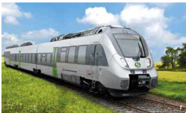
1 - 4 S-Bahn im Mitteldeutschen S-Bahn-Netz (MDSB)